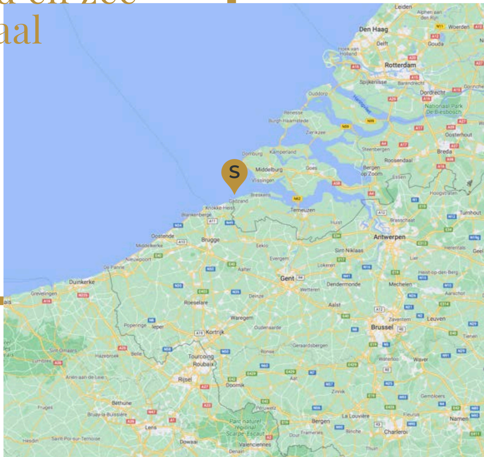
CADZAND Ligging en bereikbaarheid