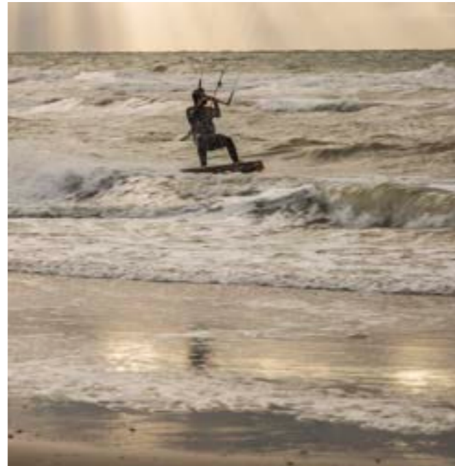
CADZAND - BAD Kitesurfer in de Noordzee

Zeeuws-Vlaanderen onderscheid zich door de speciale manier van genieten die u hier aantreft. De prachtige omgeving en de vele kwaliteitsrestaurants die de streek kent bieden een unieke verblijfplaats. Vergeet daarbij niet de heerlijke Belgische bieren en andere specialiteiten die u op elk terras kunt bestellen.